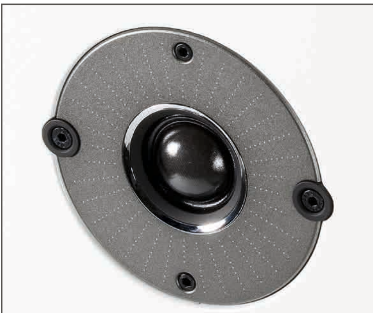
Die neuentwickelte 29-mm-Gewebehochtonkalotte löst fein auf und spielt doch sanft.

Der Lautsprecher ist ausgelegt als reine Zwei-Wege-Bassreflexbox, beide Tief-/Mitteltöner arbeiten also parallel, die Reflexöffnung befindet sich auf der Rückseite des stabilen, außer an der Rückseite sorgfältig bedämpften MDF-Gehäuses. Die Frequenzweiche ist von eher konventioneller Machart, der Durchgang im Messlabor zeigte keinerlei Auffälligkeiten, sondern belegte, dass die Dänen hier saubere Arbeit abgeliefert haben. Niedrige Verzerrungen, guter Wirkungsgrad,