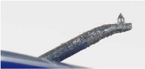
Das JT-80LB besitzt einen Aluminiumnadelträger mit „gefasst“ aufgesetztem Diamanten.

an den integrierten Phono-Vorstufen einfacherer Vor- und Vollverstärker, die „Magerkost“ schon mal mit fahlen Farben und eingeschränkter Dynamik quittieren. Das BK orientiert sich eher am unteren Rand der für MMs üblichen Werte, was für die meisten Phono-Pres allerdings kein Problem darstellt.