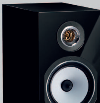
Lautsprecher Esprit Australe EZ Reichmann-AudioSysteme.de