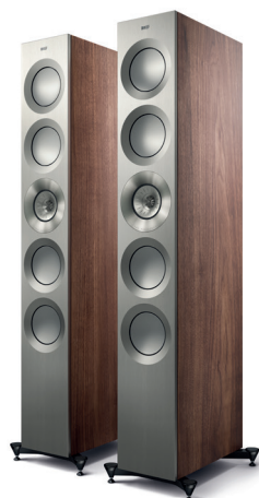
Satin Walnut/ Silver