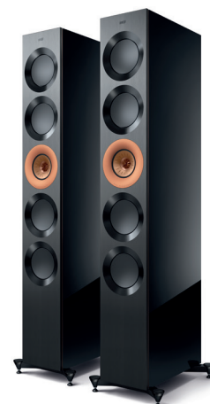
High-Gloss Black/ Copper