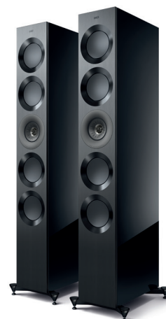
High-Gloss Black/ Grey