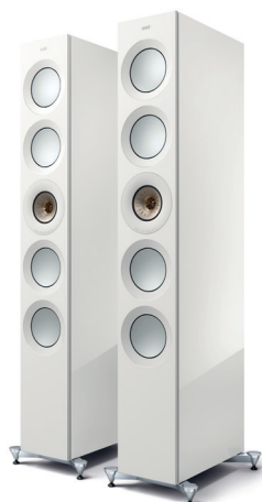
High-Gloss White/ Champagne