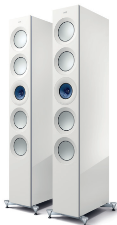
High-Gloss White/ Blue